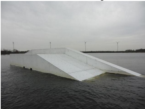
FunBox rechts (Vorderseite / Auffahrt)

In ihrer voraussichtlichen Reihenfolge auf der Wettkampfstrecke: