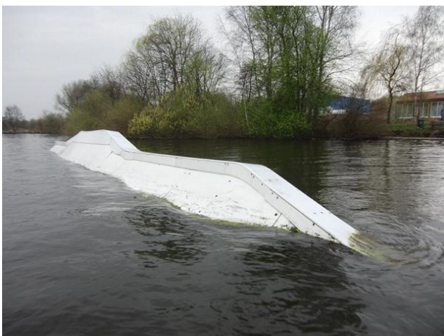
Up & Down Rail links