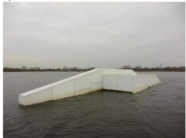
FunBox rechts (Rückseite / Abfahrt)