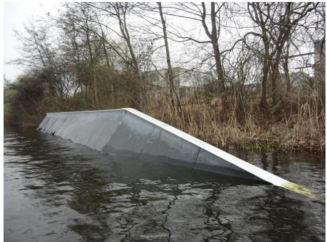
alternativ/gleiche Höhe: Slider rechts

Anzahl und Platzierung der Obstacles ist nicht verbindlich und kann sich noch ändern!