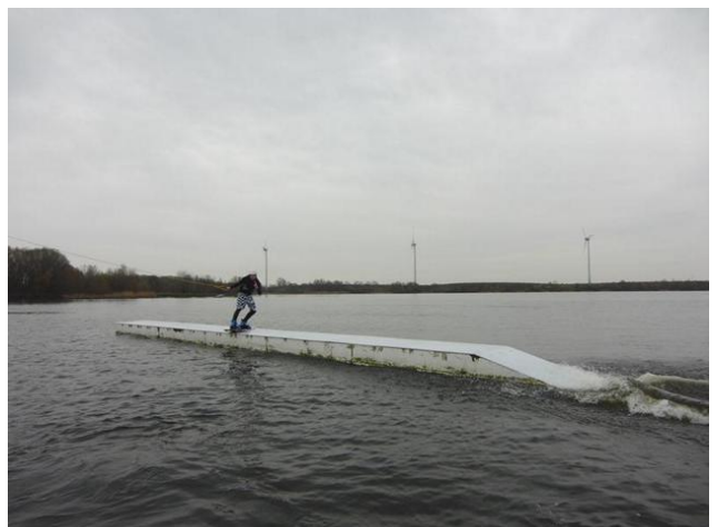
alternativ/gleiche Höhe: Table rechts