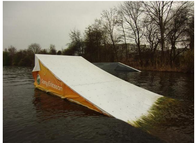
alternativ/gleiche Höhe: Kicker 3 rechts