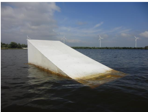
Kicker 1 rechts