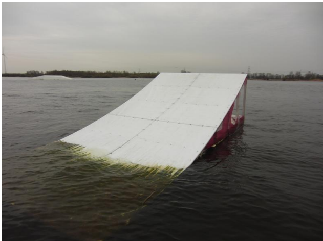
Kicker 2 links